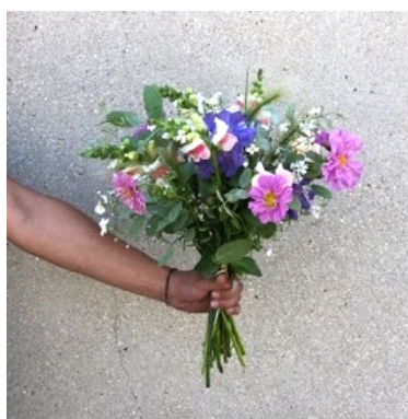
Petit bouquet : 15 €

Tarif hors contrat : 19,90 € 10 roses de 40 à 50 cm Pas de feuillage