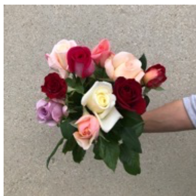
Botte de roses : 15 €

Tarif hors contrat : 15,90 € 15 fleurs de 40 à 50 cm Pas de roses ni feuillage