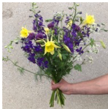
Botte champêtre : 10 €